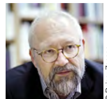
Herfried MÜNKLER Humboldt-Universität zu Berlin, Politikwissenschaftler